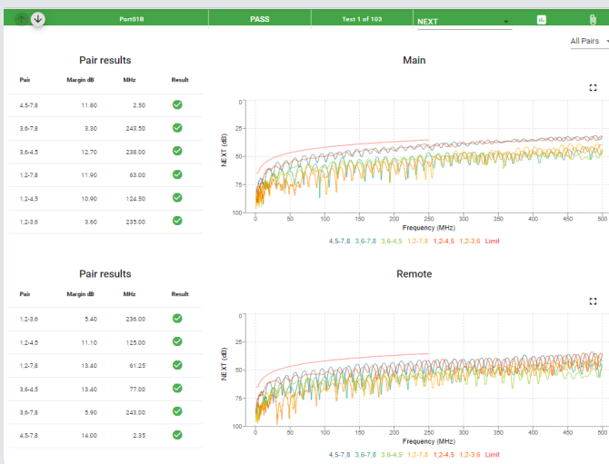
Pantalla de resultados de la prueba de TREND AnyWARE Cloud

Para actualizar su LanTEK II utilizando nuestra Promesa de soporte de por vida, envíe un correo electrónico a uksales@trend-networks .